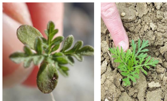
À la germination : cotylédons arrondis typiques (3 à 4 mm), tige velue, feuilles découpées (début mai 2022).

Retrouvez l'encart ambrosie dans les bulletins de Santé du Végétal BSV-grandes cultures 2023 (voir p.16 pour le n°20)