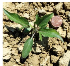
Germination d'ambroisie trifide. Si vous en rencontrez, signalez-la au plus vite !