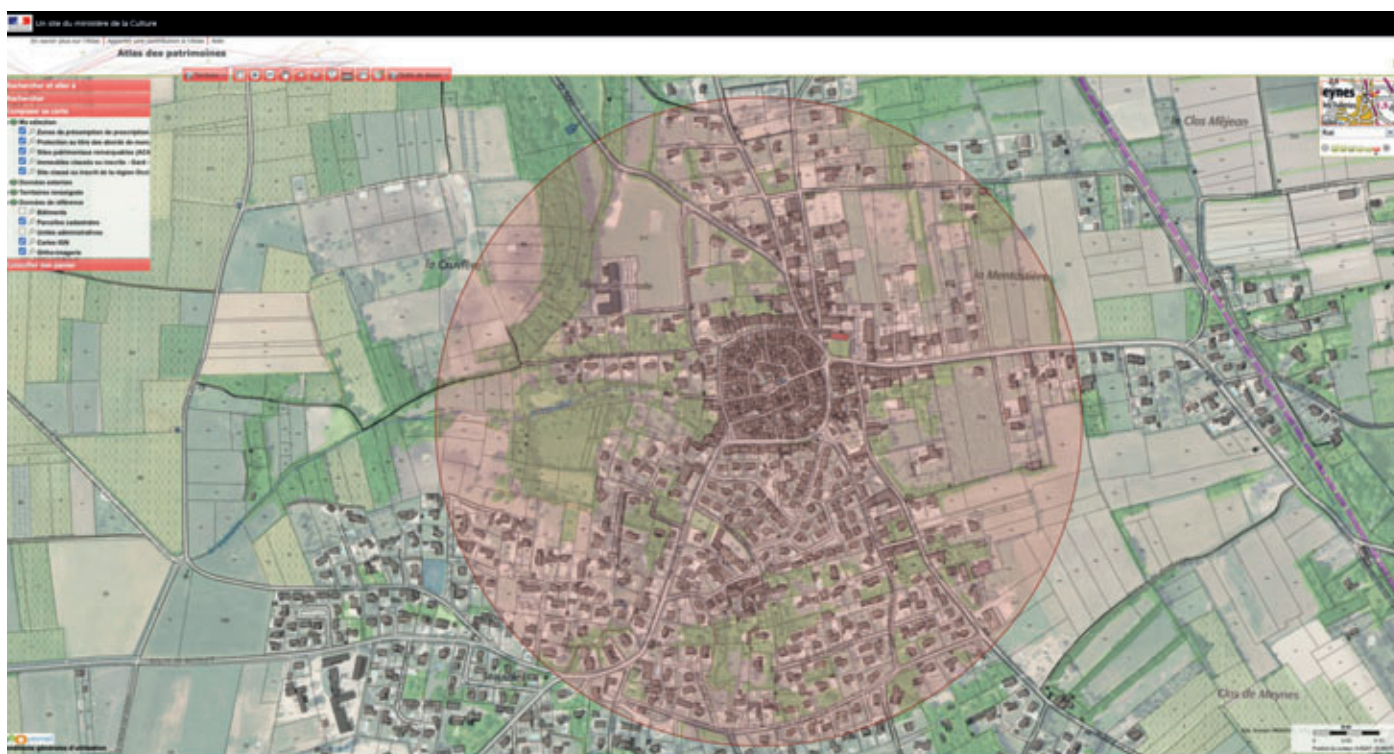
Périmètre de protection actuel de 500m généré par le monument historique

protection d'un rayon de 500m dans lequel tous les projets sont soumis à la consultation obligatoire de l'ABF. Ce périmètre a pour but d'instaurer un écrin autour du MH, afin de permettre sa mise en valeur en portant une attention particulière à l'environnement proche, urbain et paysager.