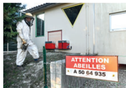
La zone est sécurisée par un grillage et des panneaux

Suite à l'installation par les services techniques des aménagements nécessaires, les élèves ont pu observer les abeilles en se mettant dans la salle de motricité de l'école maternelle (Les ruches possédant chacune une paroi transparente collée contre une surface vitrée de cette salle). Le responsable de « l'Abeille rouge » prévoit également des interventions en classe. Les élèves pourront visiter le rucher une fois par an, par petits groupes, en habits d'apiculteur. Une belle expérience que les élèves de CM2 ont déjà réalisé.