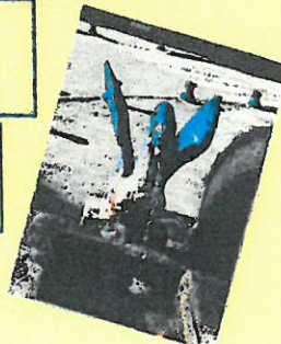
MEYNES (Gard) - Vue Générale