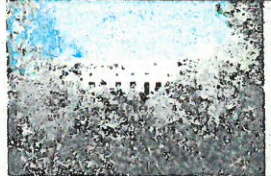
Le Château vu depuis la piscine