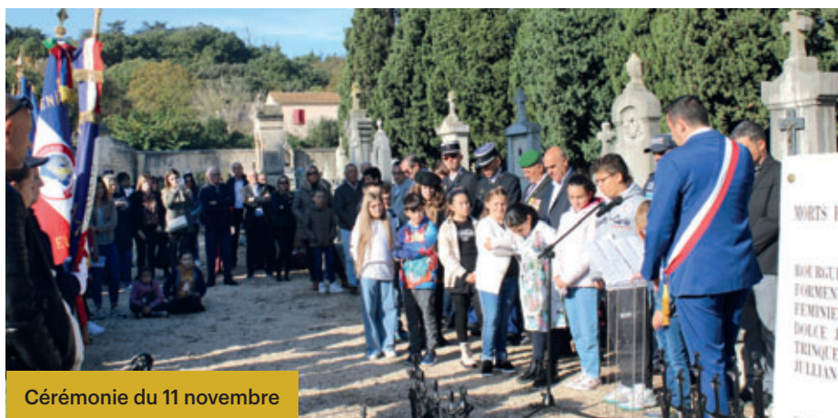
Cérémonie du 11 novembre