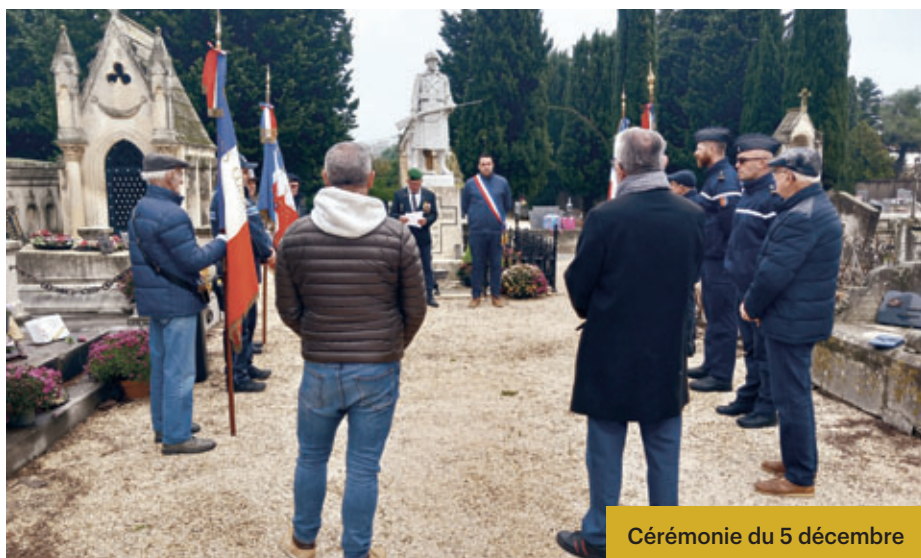
Cérémonie du 5 décembre