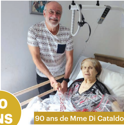
90 ans de Mme Di Cataldo